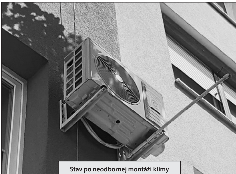
Stav po neodbornej montáži klímy

Servis pomerových rozdeľovačov tepla (odparovacích aj elektronických prístrojov) na vykurovacích telesách (radiátoroch) vykonáva výlučne servisná služba firmy Techem spol. s r.o. Nové Zámky. Pri poškodení, spadnutí prístroja, po výmene radiátora a podobne, je potrebné obrátiť sa priamo na pobočku firmy Techem v Nových Zámkoch na tel. č. +421 35 6420424.