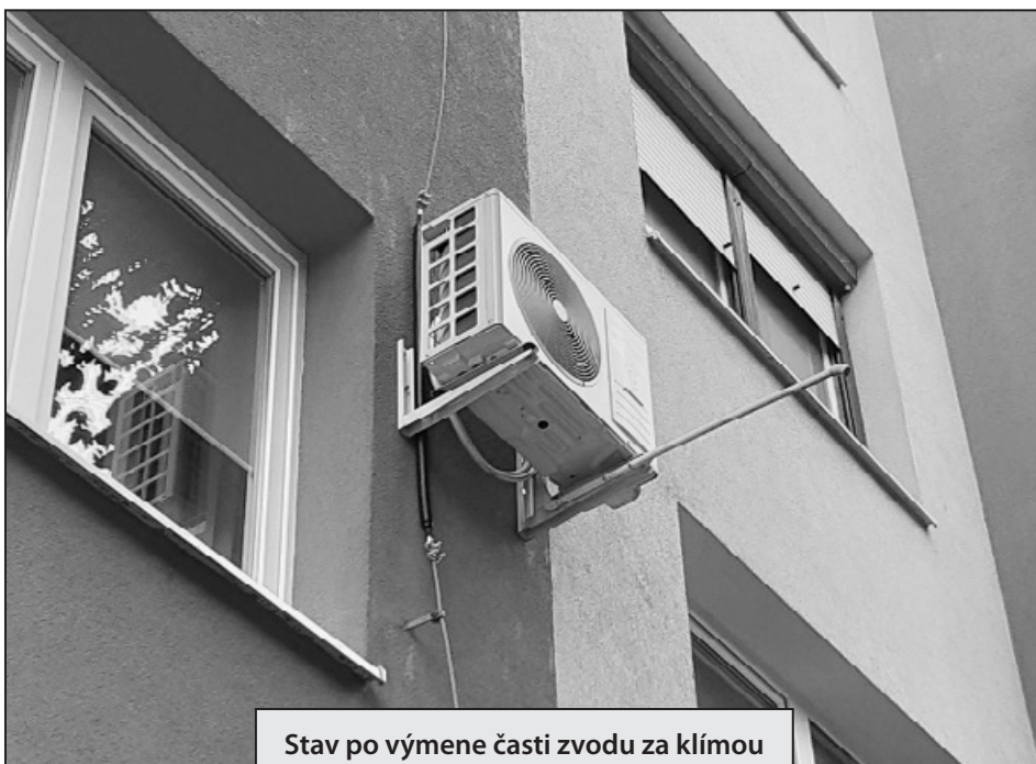
Stav po výmene časti zvodu za klímou